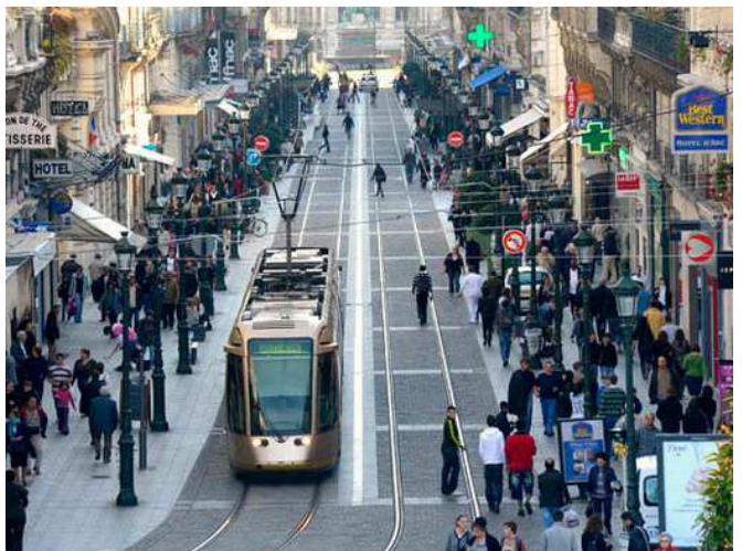
Les bouchons et les voitures garées sur les trottoirs ont disparus sous l'influence du tramway.