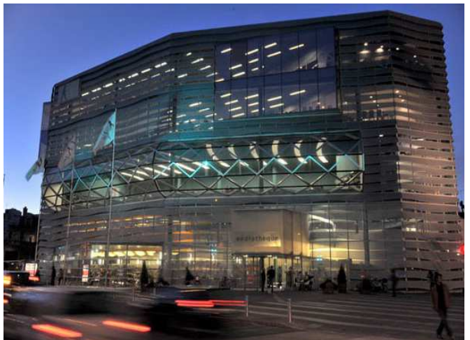
La médiathèque, dessinée par les architectes Pierre du Besset et Dominique Lyon, a été recouverte d'une ondulante dentelle métallique.