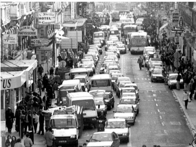
La rue de la République, principale rue commerçante d'Orléans.