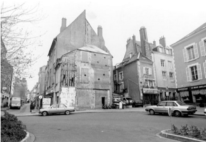
Place du Châtelet, à l'angle des rues de la Cholerie et du Poirier, avant la réhabilitation du centre-ville.