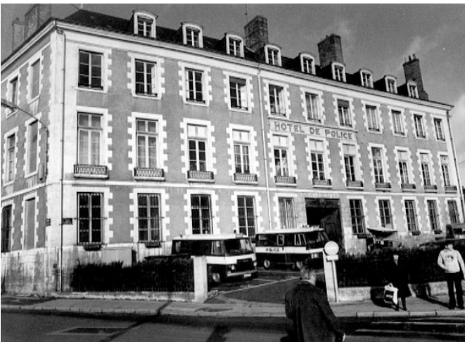
Place Gambetta, l'hôtel de police a été rasé pour construire, en 1994, une médiathèque.