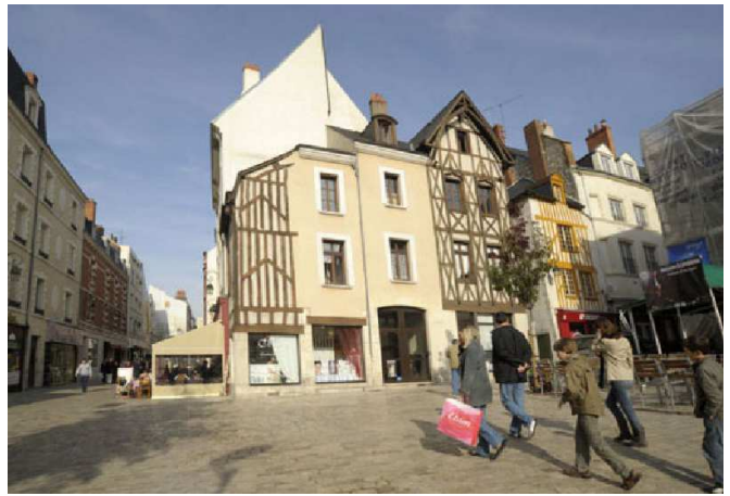
On peut constater l'ampleur de la rénovation : la première façade affiche un style rustique des années 1980, la deuxième a été construite selon des plans de 1840 et la troisième a retrouvé ses pans de bois dorés du 18ème siècle. La place a aussi été entièrement pavée.