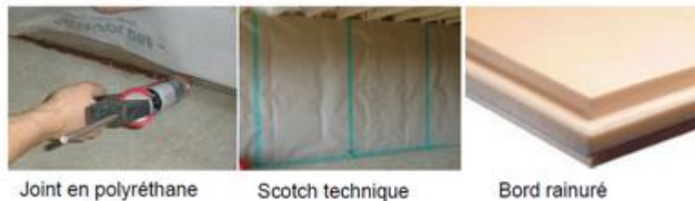
Joint en polyuréthane