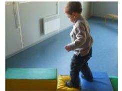
IL MARCHE SUR LES MOUSSES.

L'enseignant pourra reprendre au moyen de photos ou vidéos ces éléments de langage avec l'élève. Il pourra constituer avec lui un « album écho » en version papier ou numérique inspiré des travaux de Philippe Boisseau « Enseigner la langue orale en maternelle ».