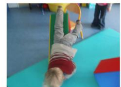
J'AI GLISSE SUR LE TOBOGGAN.