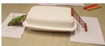
Construire la maquette d'un parcours de motricité

Imagine un parcours où ton petit personnage préféré devra grimper, sauter, ramper... Pour cela utilise le matériel que tu trouves à la maison.