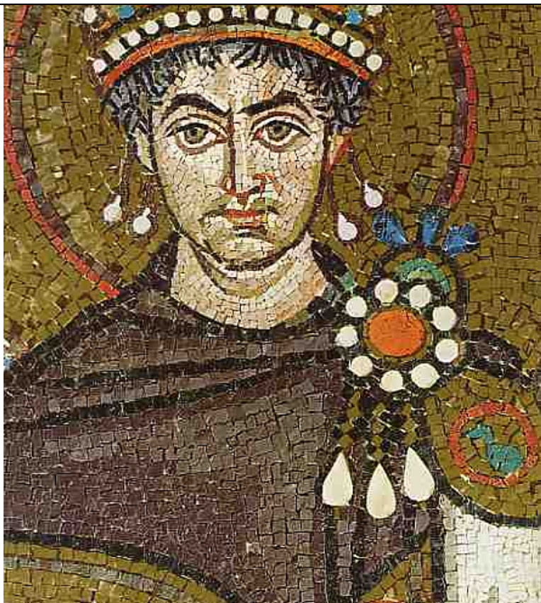
Empereur Justinien (527-565)

Pourquoi l'Empereur a-t-il fait construire ce monument ?