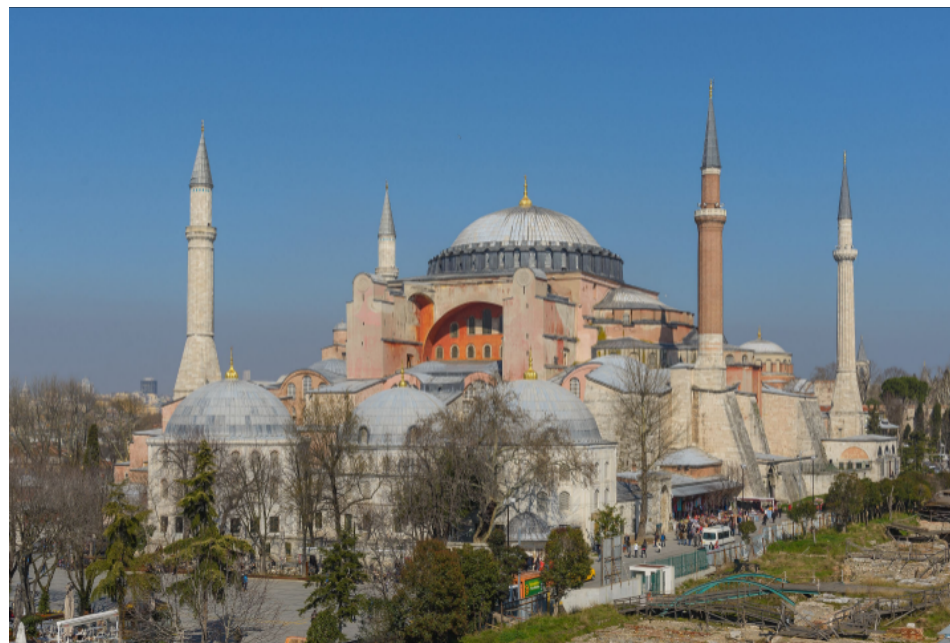
Basilique Sainte Sophie (Début de la construction en 532)

[Détail de mosaïque, Basilique San Vitale, Ravenna]