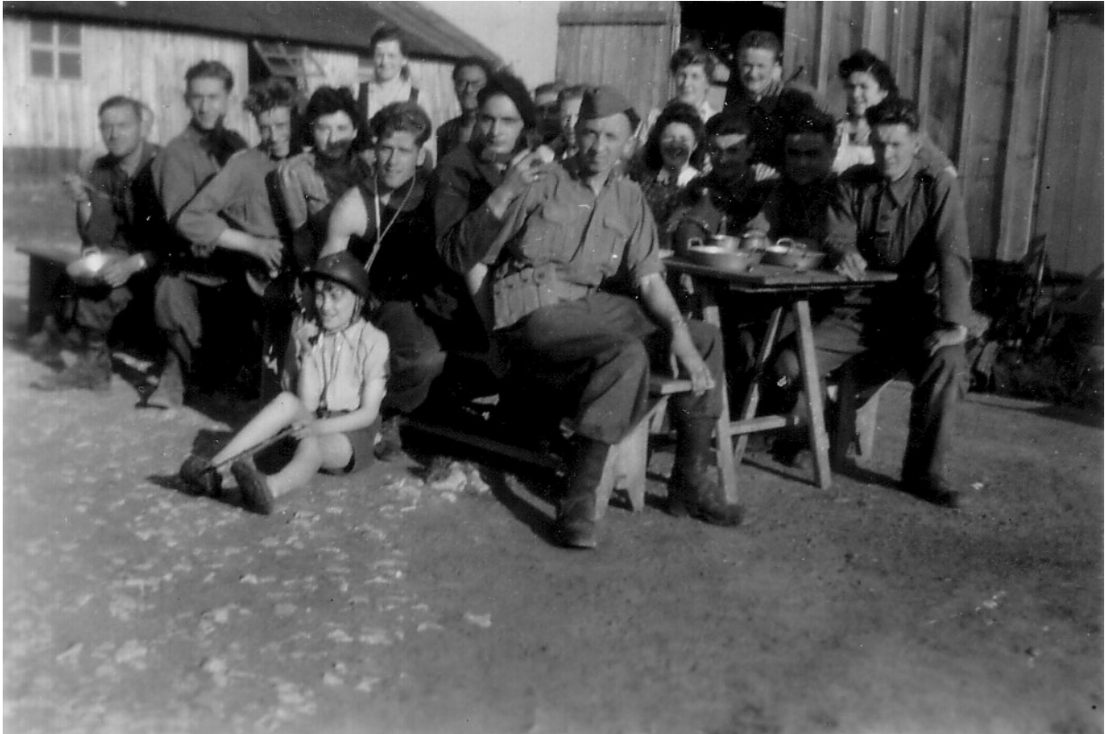
Le maquis fête la Libération avec les « hébergés » du camp de Douadic, mi-septembre 1944 Membres du maquis et « hébergés » du camp sont mélangés autour de la table.