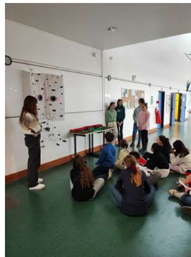
Workshop en salle d'arts plastiques - Collège de Bû (28)