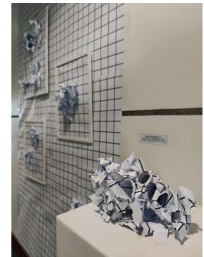
Détails des productions d'élèves