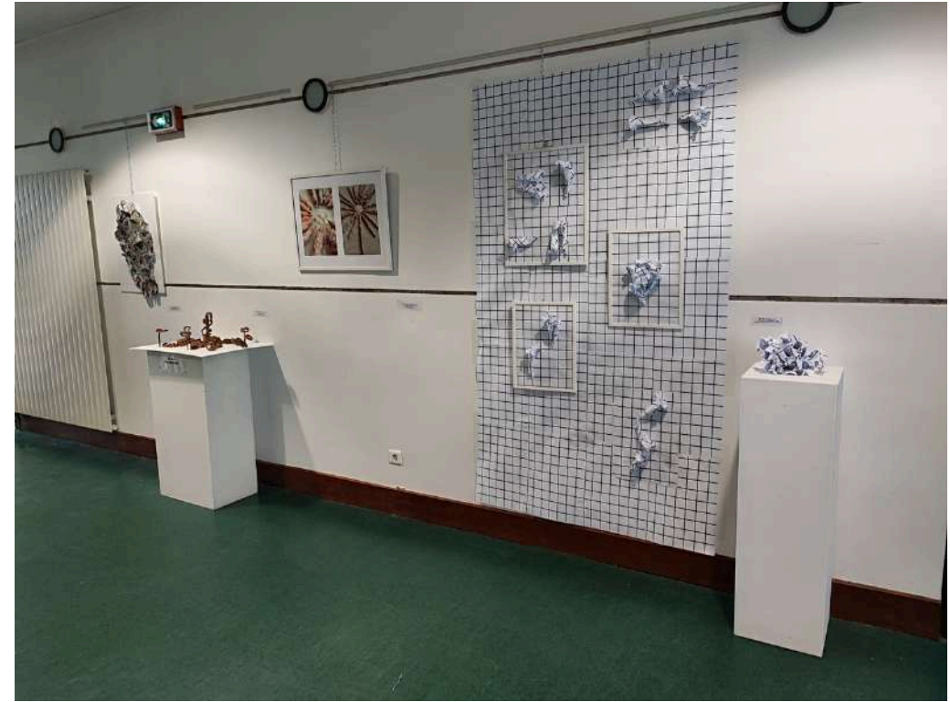
Vue de l'exposition organisée avec les productions des élèves