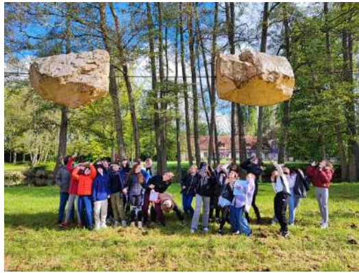
Visite du domaine des Oseraies - Avril 2024